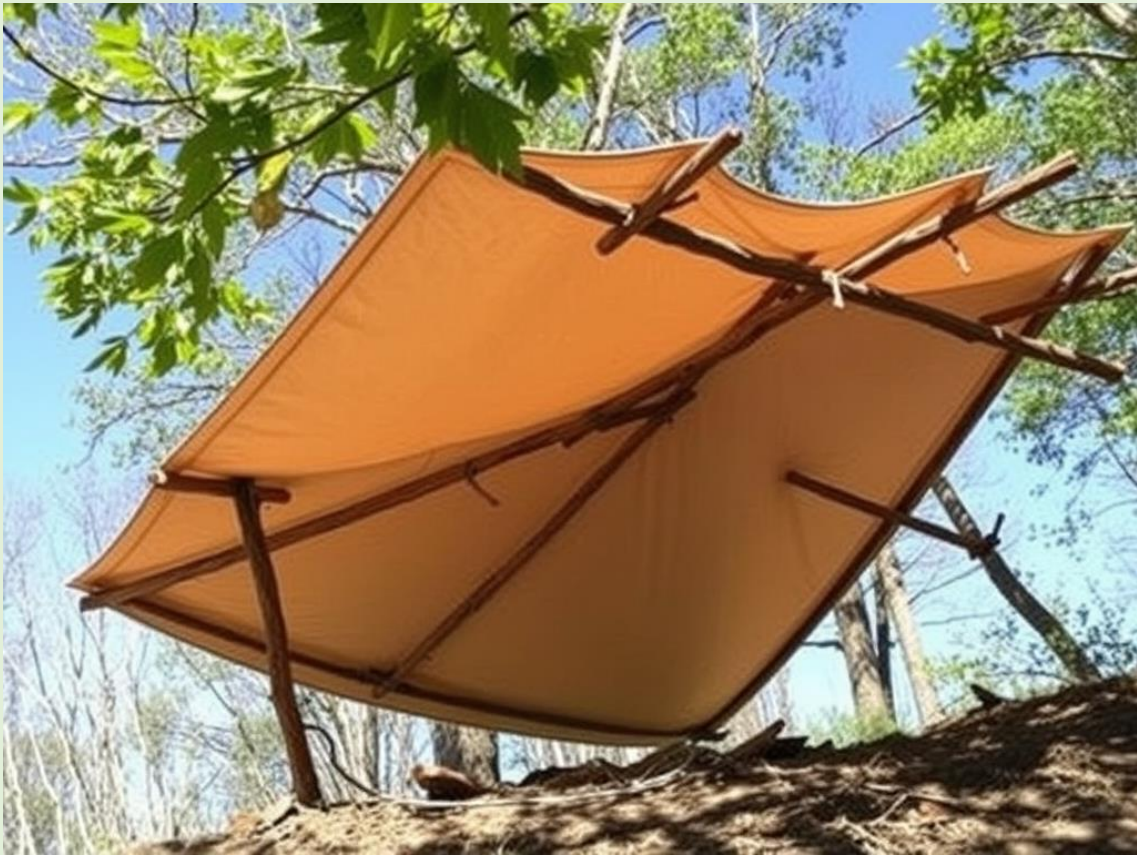
Esquema básico de un refugio tipo Lean-To (Apoyado)